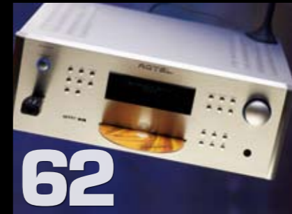
Budsjettreferansen: Rotel RCX-1500 Stereo CD Receiver