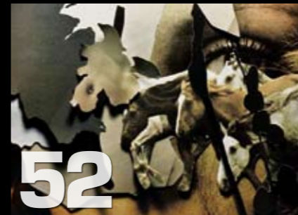
Musikkomtaler: Skeive skiver