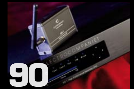
Electrocompaniet Prelude PD 1 USB-DAC