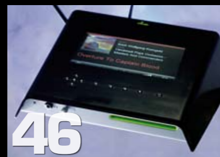
Olive 06HD CD-spiller, rippet, Dac, server og pre