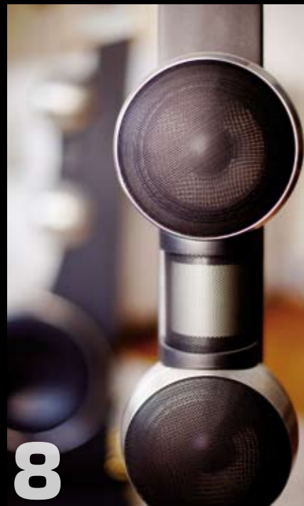
Gruppetest 5 høyttalere