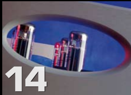
Rør eller transistor?