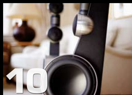
Gruppetest: Anthony Gallo Acoustics Ref 3,5