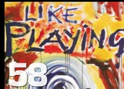
Musikkomtaler: Blått & rått