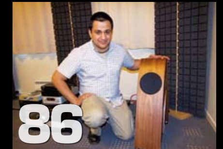
Bilde- og lydmesse Triaden