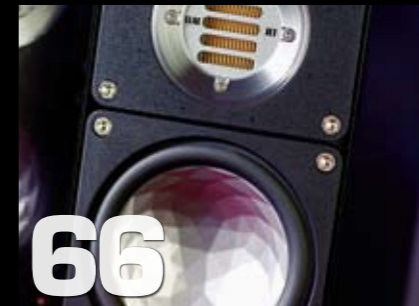
Gruppetest: Elac 310 Crystal Edition stativhøytaler