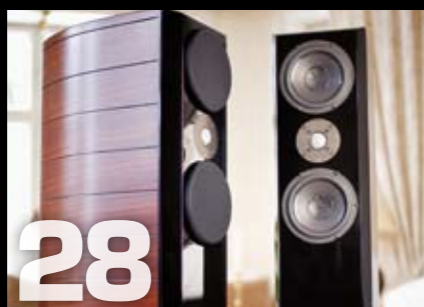
Gruppetest: Usher Dancer Mini- Two Diamond DMD gulvstående