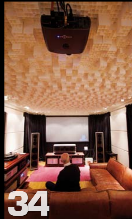
Hjemme hos JackX