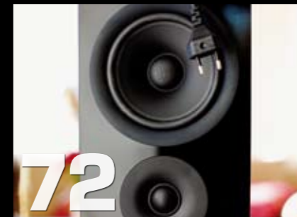
Gruppetest: Audio Pro Image Blue Diamond V3