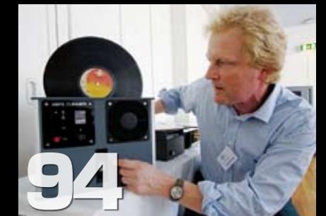
Audio Desk platevasker