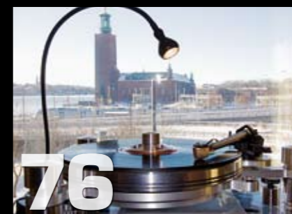
Stockholm High End messe 2011