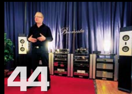
Butikkmesse i Oslo