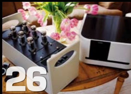
Rør eller transistor: Sec. op.