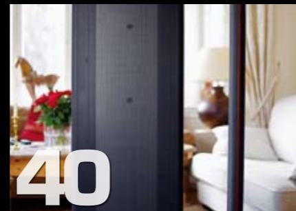
Gruppetest: Magnepan 1.7