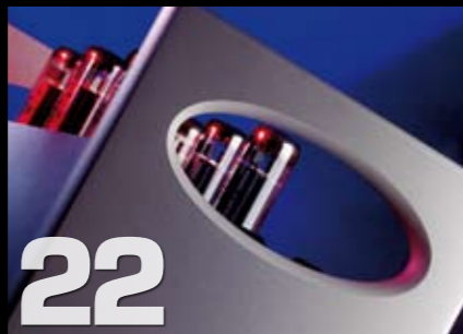
Rør eller transistor: Rogue Apollo mono rørforsterker