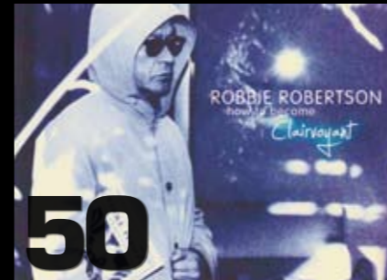
Musikkomtaler: Glimmer og gråstein