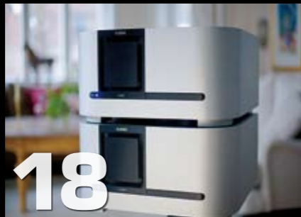
Rør eller transistor: Classé Audio CA-M600 mono effektforsterker