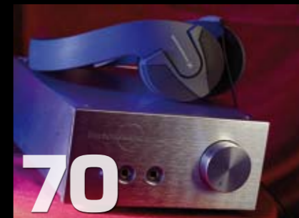
Burson Audio HA-160 Headphone Amplifier